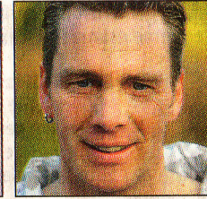
Wäscht sich öfter: Jürgen Milski