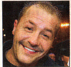
Ballermann-Star Willi Herren